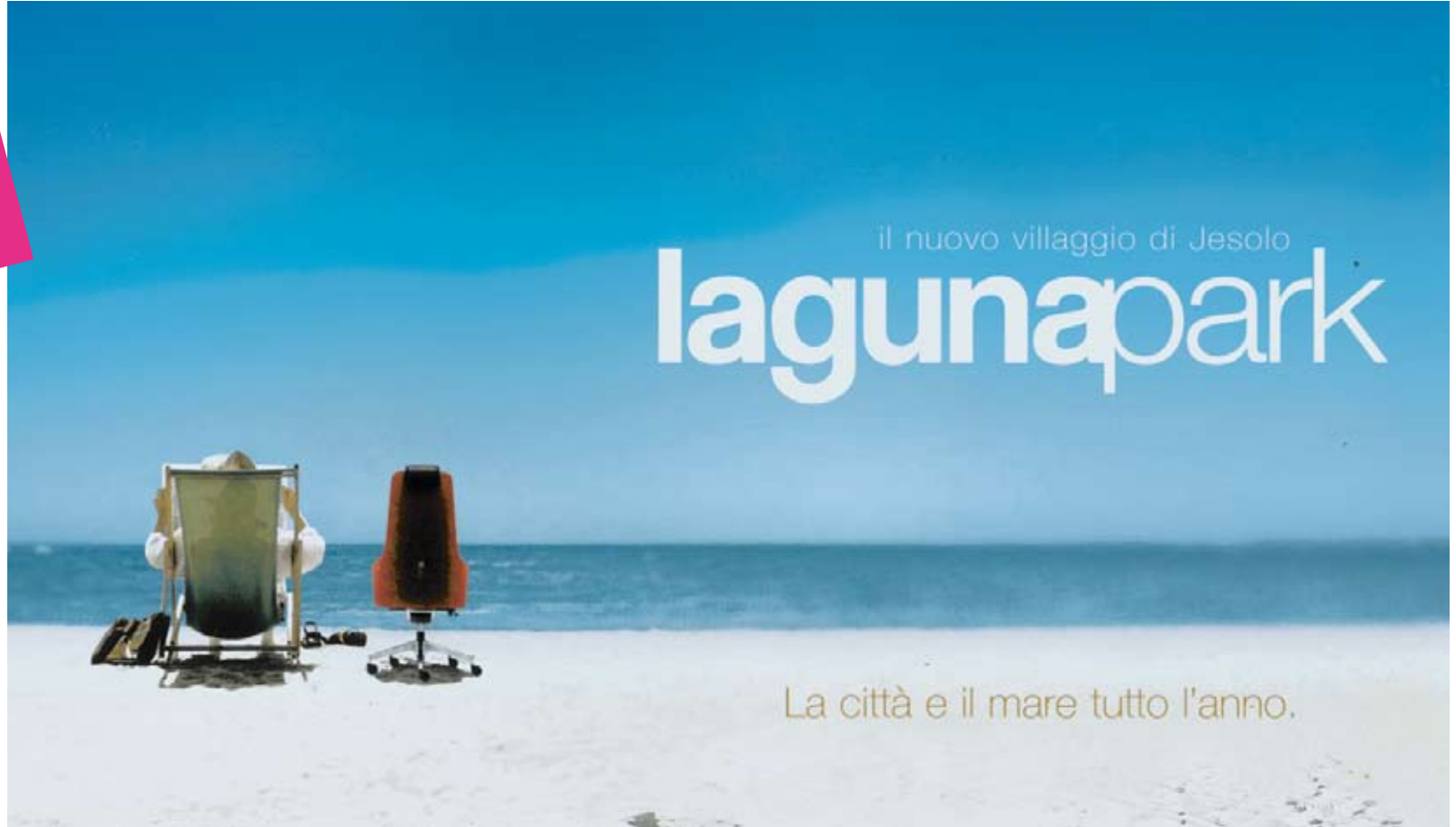
Lagunapark is a new village in Jesolo